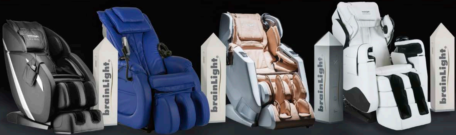
brainLight relaxTower mit brainLight-Shiatsu-Massagesesseln

Entspannungstechnologie Made in Germany! Mehrfach prämiert für: Innovation, High Quality, Design, Funktionalität und Ergonomie. Von der PLUS X Award Jury ausgezeichnet als „Tiefenentspannungssystem des Jahres“ und „Bestes Produkt des Jahres“ 2012/13, 2013/14, 2014/15, 2016/17/18 und 2021.