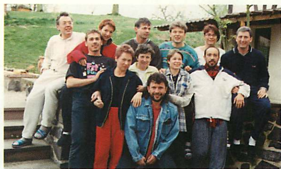
Entspanntes Teilnehmerfeld dank Brainlight.

„Schonhaltung“ zu einer psychisch wie körperlich auf Dauer ebenso ungesunden Unterforderung führen würde. Auch Psychopharmaka, Glückspillen oder Beruhigungsmittel können das seelische Tief nur dämpfen, die Ursache bleibt unverändert. Dem soll das Seminar-Konzept „Stress laß' nach“ gegenwirken. Der Stress wird lokalisiert, verborgene Quel-