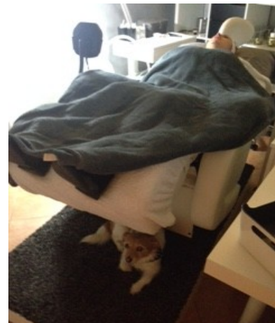
Auch bei Vierbeinern beliebt ;-)